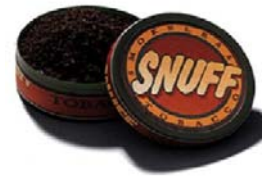
Smokeless/ Chewing Tobacco