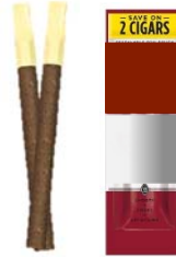
Cigarillos/Little Cigars (ex. Swisher Sweets, Black & Mild, etc)